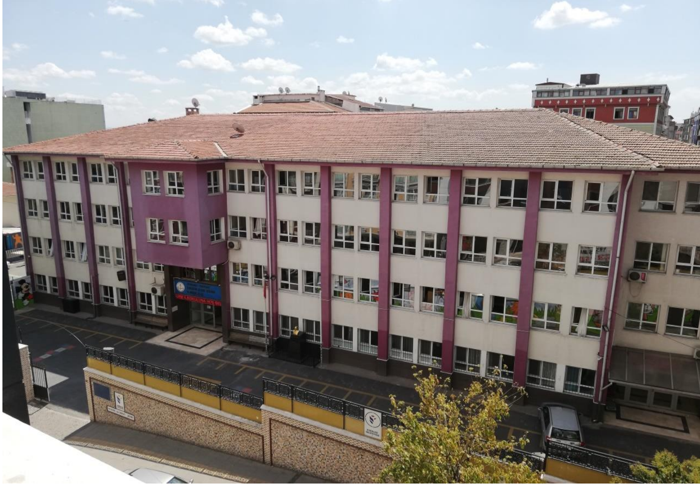
ENGİN CAN GRE İLKOKULU